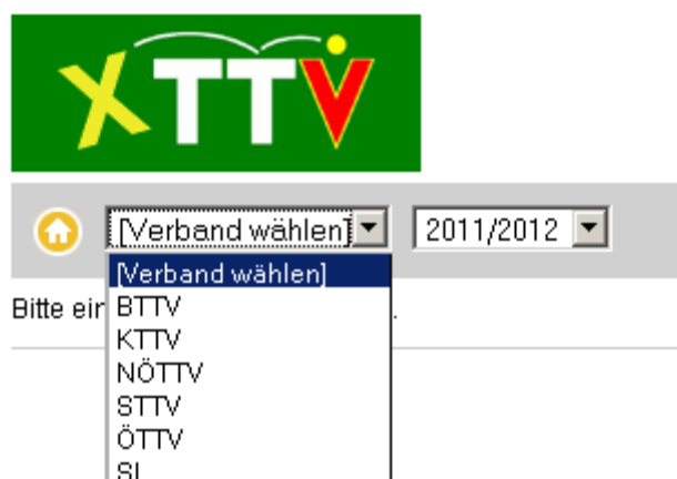
Abb. 1: Verbandsauswahl

Für die Anzeige von Ergebnissen, Tabellen und Ranglisten ist keine Anmeldung erforderlich. Sollte noch kein Verband ausgewählt sein oder sollen die Daten eines anderen Verbands angezeigt werden, muss in der Kopfzeile der gewünschte Verband und das gewünschte Spieljahr ausgewählt werden (Abb. 1). Anschließend stehen die einzelnen Spielklassen dieses Verbands zur Auswahl zur Verfügung.